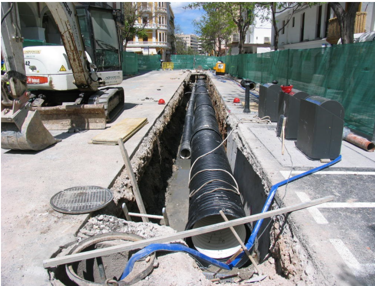
Trazado por la calle Bartomeu Ramón y Tur

El proyecto descrito puede considerarse una buena práctica porque: